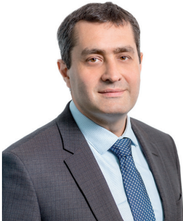
Данііл Майданік Почесний Президент Асоціації газовидобувних компаній України

«Цей рік буде визначальним для майбутнього вітчизняного газовидобутку. Індустрія очікує на значну пропозицію нових блоків та ділянок з боку держави, які пропонуються шляхом нафтогазових онлайн-аукціонів та конкурсів УРП. Нові площі як повітря потрібні для подальшого зростання видобутку газу, що дозволить залучити в галузь нові інвестиції та сучасні технології, без яких розвиток індустрії неможливий.